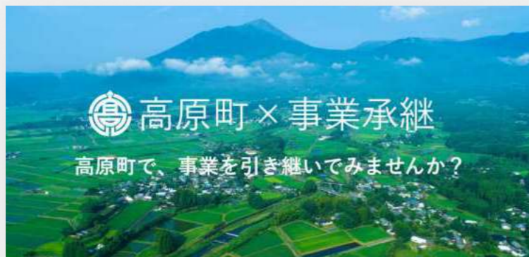
2020.10 自治体連携『relay the local』を開始