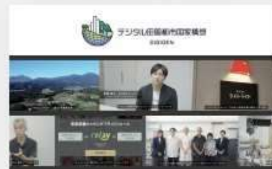
2023.12 内閣官房デジタル田園都市国家構 想公式ホームページ内「地方に仕 事をつくる」の事例として掲載