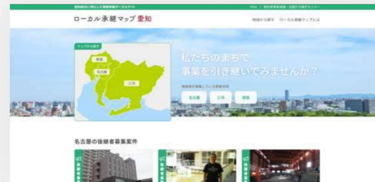
2021.12 愛知県事業承継・引継ぎ支援センターと連携 『ローカル承継マップ愛知』公開