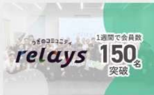
2023.11 第三者承継コミュニティ 「relays（リレイズ）」をローンチ 1週間で会員数150名突破！