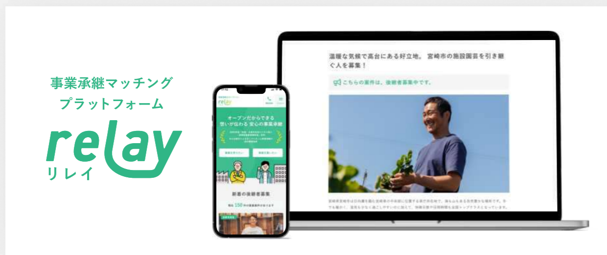
2021.10 M&A支援機関登録制度登録