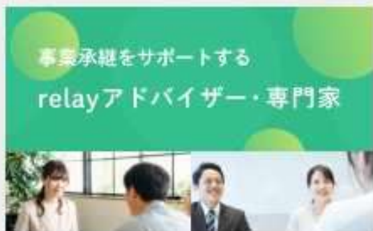
2023.6 アドバイザー・専門家制度を開始